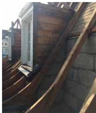
Dieses Walmdach einer Villa in Heidelberg sollte energetisch saniert werden. Die Herausforderung: Verschiedene Innenbeplanungen wie Holz und Putz etc. Zudem fehlte hinter dem Drempelelge Unterkonstruktion

Oberste Priorität bei der Sanierung von Dachwohnungen hat in der Regel die energetische Erleichterung. Doch spielt auch die Behaglichkeit eine zunehmend wichtige Rolle. Denn viele unsanierte Dachwohnungen sind ungemütlich. Das liegt am unzureichenden Wärmeschutz, einhergehend mit kalten Außenwänden und mangelhafter Luftdichtheit, die zu Zugserscheinungen und trockener, unangenehmer Raumluft führt. .