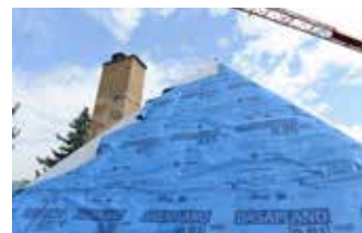
Fertige Luftdichtungsbahn über 2/3 der Dämmung vor Belegung mit Unterdeckplatten

bestehende Sparrengefach komplett ausgedämmt. Anschließend wird die Luftdichtungsbahn über die Sparren verlegt und mit einer Aufsparrendämmung aus Holzfaserunterdeckplatten überdämmt.