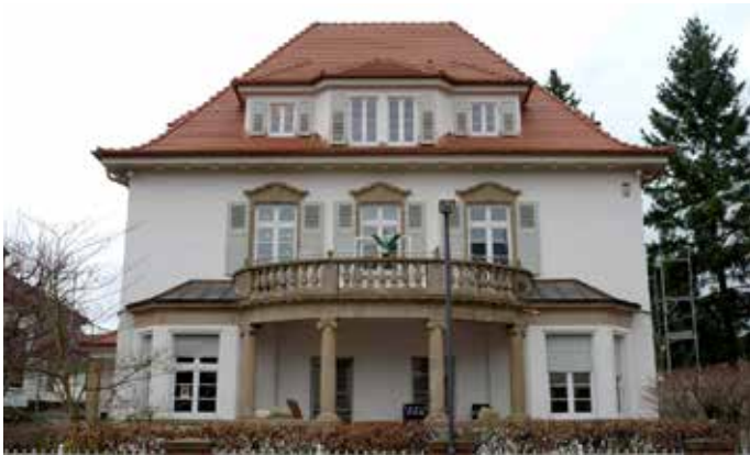
Fertige Dachsanierung einer Villa

Oberste Priorität bei der Sanierung von Dachwohnungen hat in der Regel die energetische Erleichterung. Doch spielt auch die Behaglichkeit eine zunehmend wichtige Rolle. Denn viele unsanierte Dachwohnungen sind ungemütlich. Das liegt am unzureichenden Wärmeschutz, einhergehend mit kalten Außenwänden und mangelhafter Luftdichtheit, die zu Zugserscheinungen und trockener, unangenehmer Raumluft führt. .